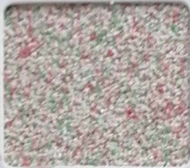
Code No 271