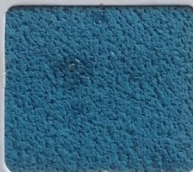
Code No 326