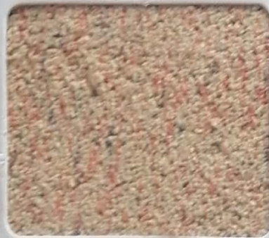
Code No 277