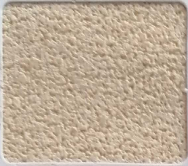
Code No 316