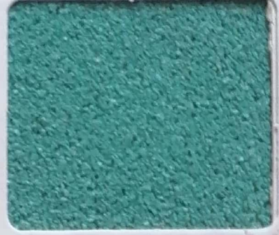
Code No 288