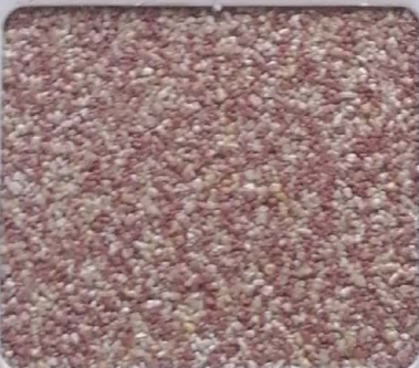
Code No 295