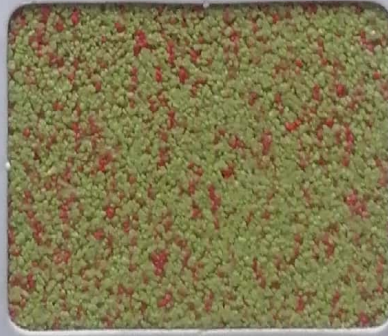
Code No 359