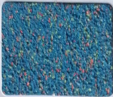
Code No 302