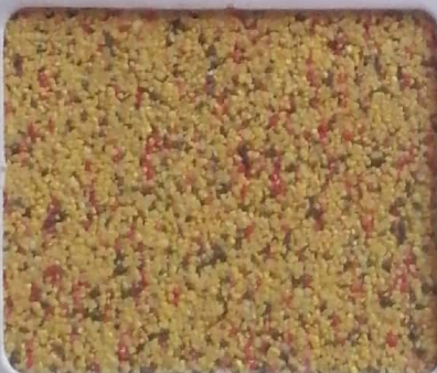
Code No 313