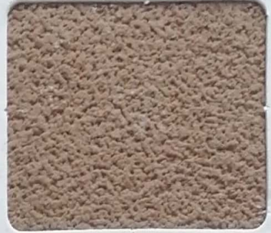
Code No 333