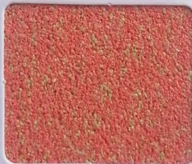
Code No 311