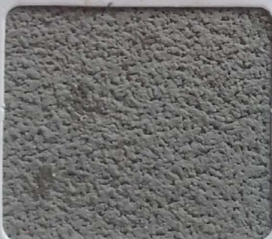
Code No 325