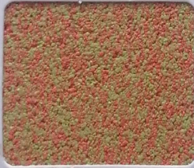
Code No 355