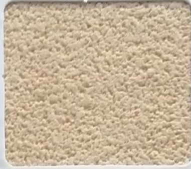
Code No 332