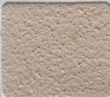
Code No 340