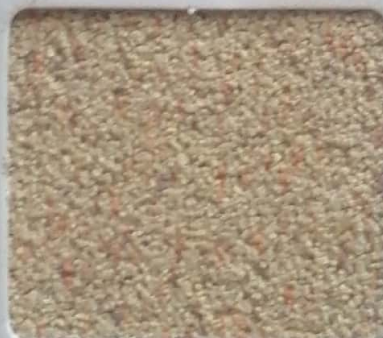
Code No 283