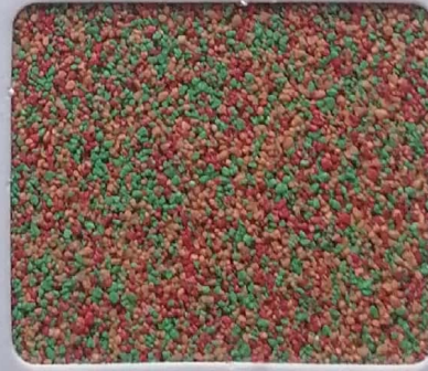
Code No 356