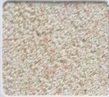
Code No 272