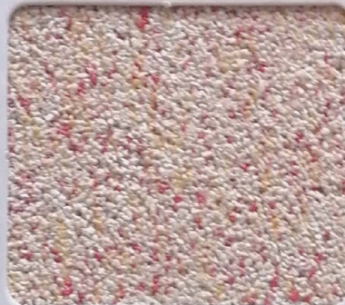
Code No 293