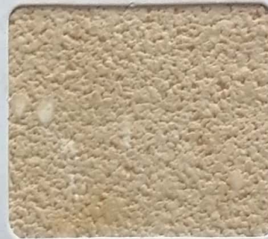
Code No 338