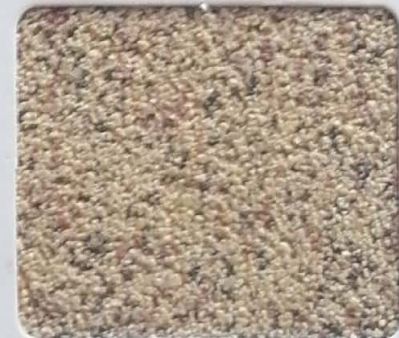
Code No 279