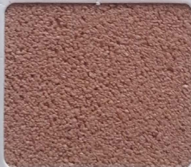
Code No 296