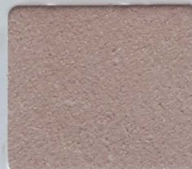
Code No 344