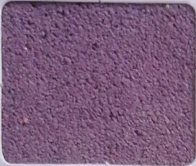
Code No 304