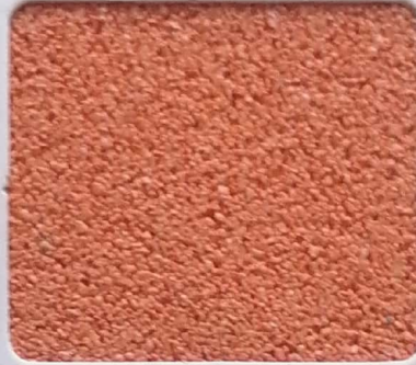
Code No 290