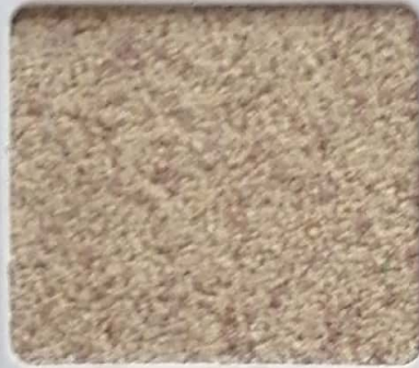
Code No 274