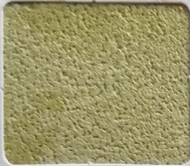
Code No 319