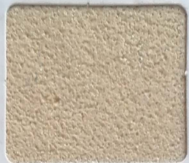
Code No 318