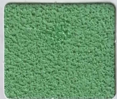
Code No 321