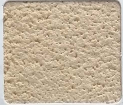
Code No 336