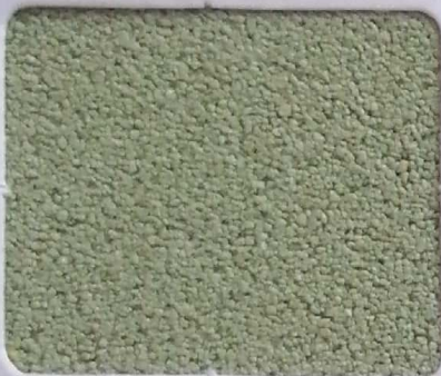
Code No 307