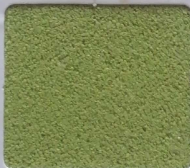
Code No 299