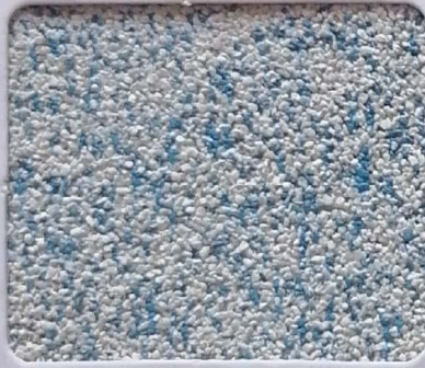
Code No 352