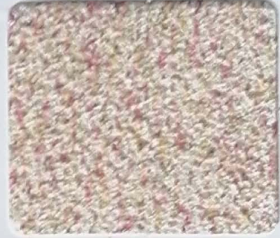
Code No 273