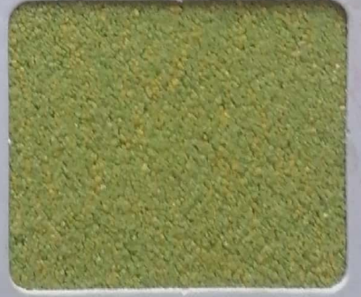
Code No 360