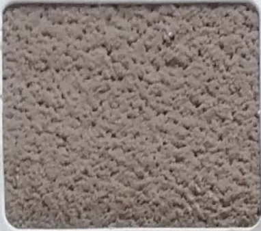
Code No 331