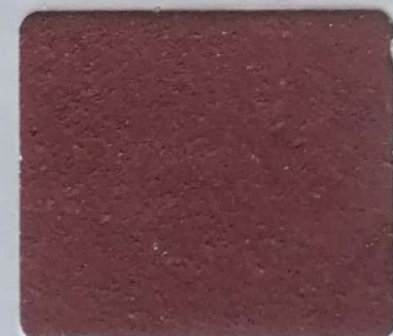
Code No 345