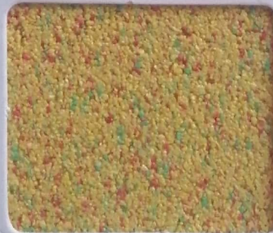
Code No 314