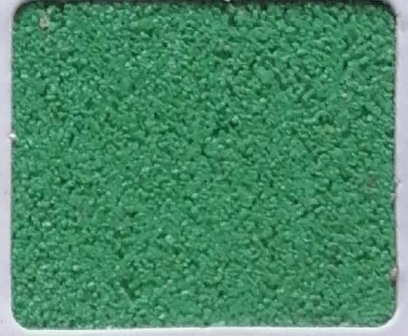
Code No 348