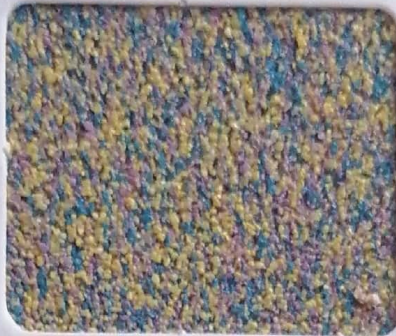
Code No 305