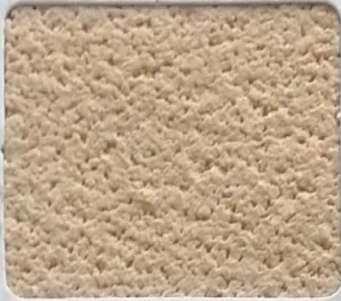
Code No 334