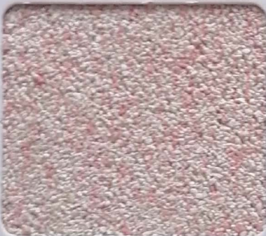
Code No 292