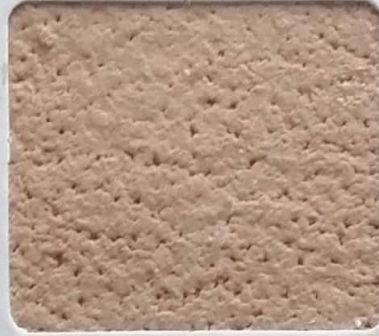
Code No 335