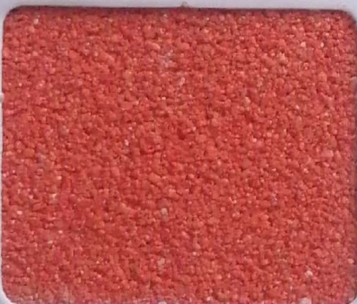
Code No 310