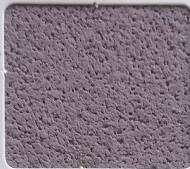
Code No 320