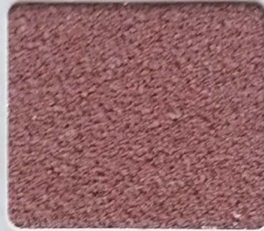
Code No 275