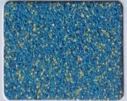
Code No 303