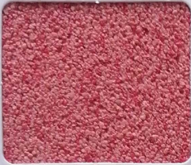
Code No 349