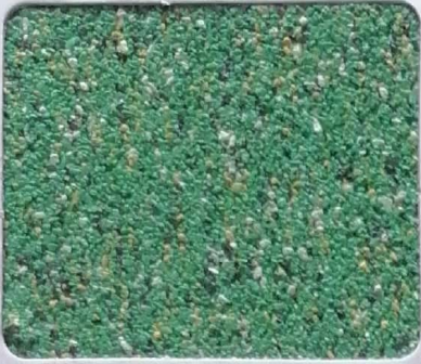
Code No 346