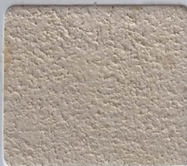
Code No 329