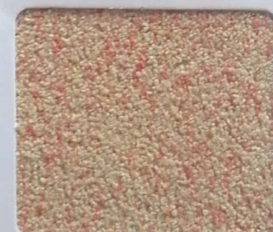
Code No 285