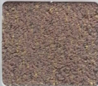
Code No 280