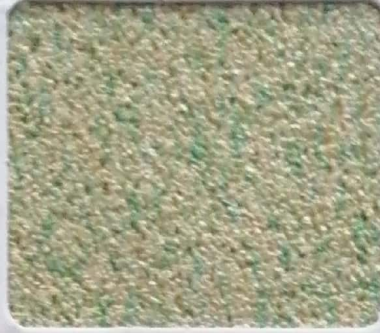
Code No 287