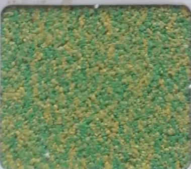
Code No 298