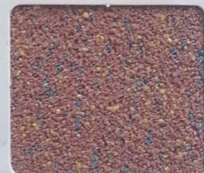
Code No 282