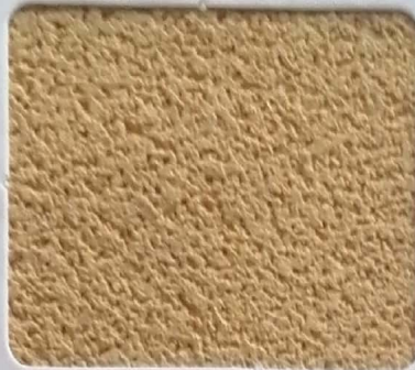
Code No 317