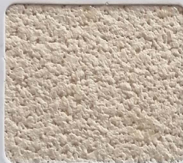
Code No 323