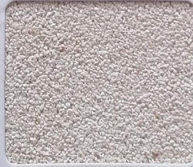
Code No 353