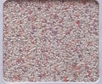
Code No 354