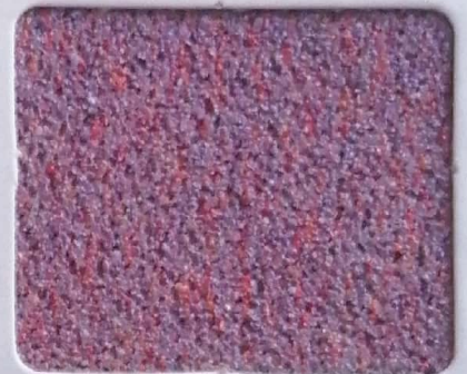
Code No 306