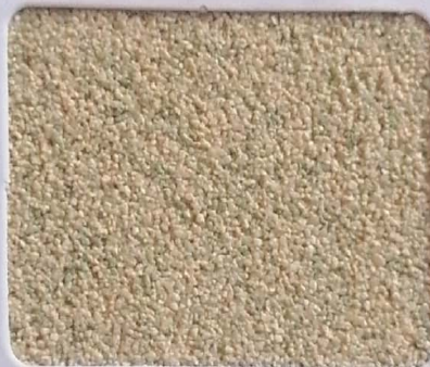
Code No 308