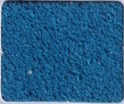
Code No 301