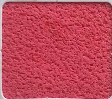
Code No 322