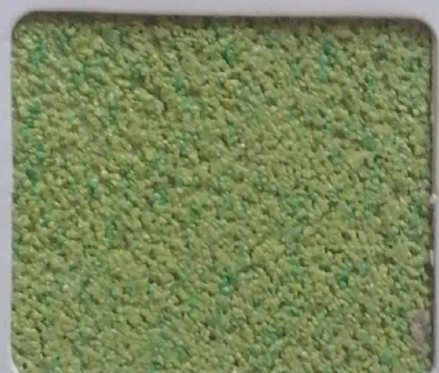
Code No 300