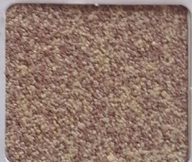
Code No 297