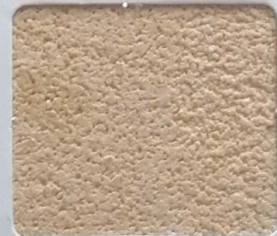
Code No 342