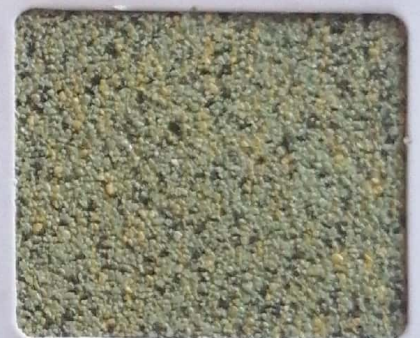
Code No 309