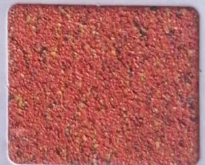
Code No 312