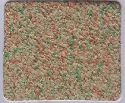
Code No 357