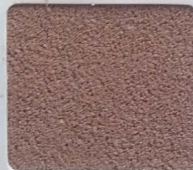
Code No 281