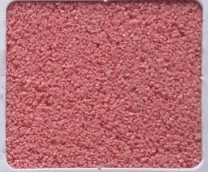
Code No 351