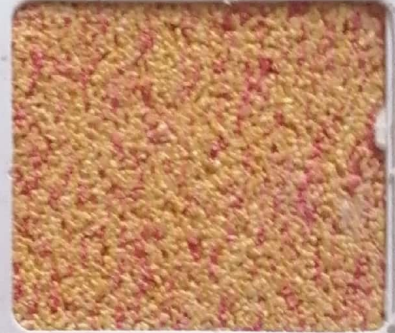
Code No 291