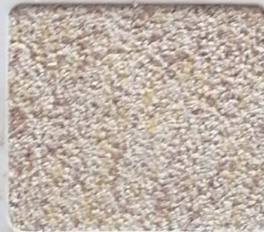
Code No 278