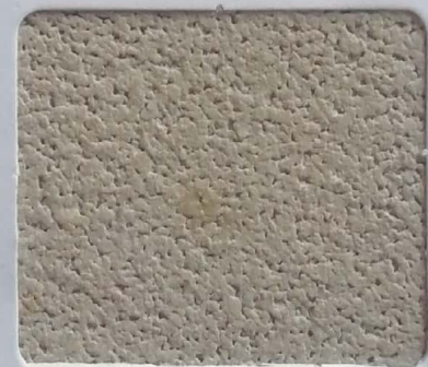
Code No 330