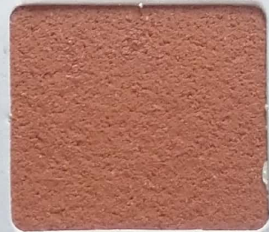
Code No 339