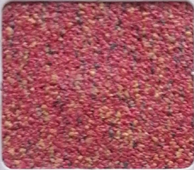
Code No 289