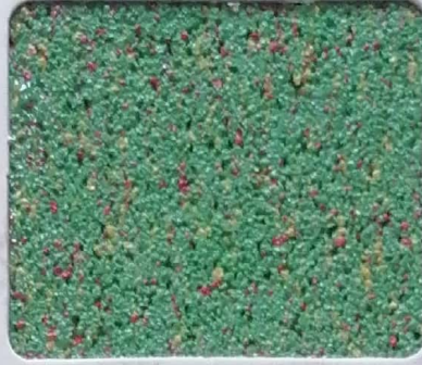
Code No 347