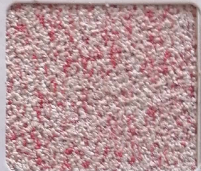
Code No 294