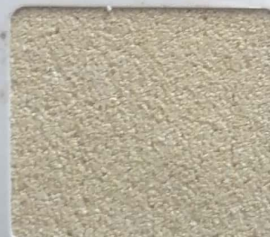
Code No 284