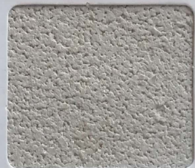
Code No 327