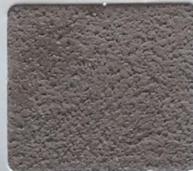
Code No 341