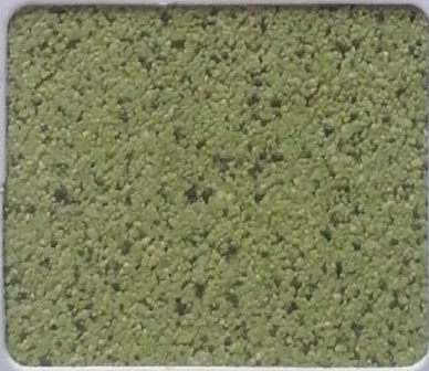
Code No 358