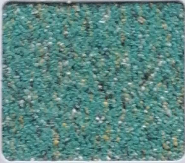
Code No 286