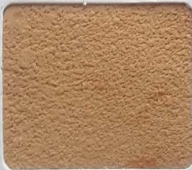
Code No 337