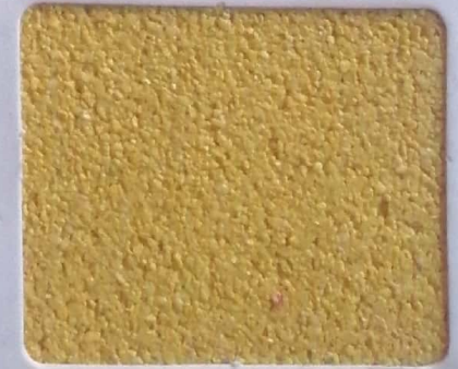
Code No 315