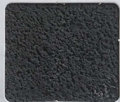
Code No 324