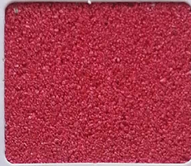
Code No 350