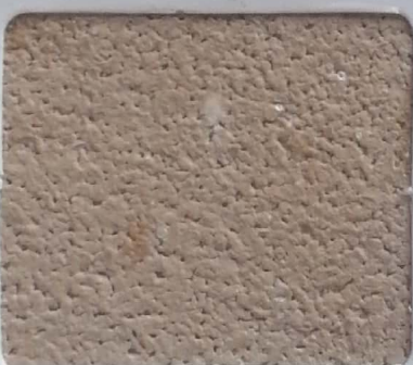
Code No 328