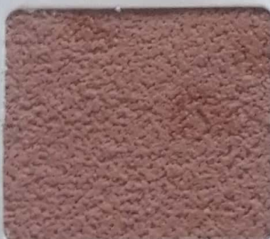
Code No 343